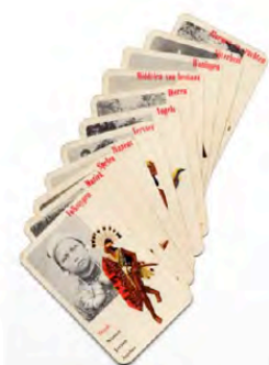
Koloniaal kwartetspel, ca. 1942.

In de Tweede Wereldoorlog – waarschijnlijk vroeg in 1942 – bracht het toenmalig Koloniaal Instituut in Amsterdam een kwartetspel uit (serie 3718-2045). Nederland was bezet door de Duitsers. Het kwartetspel bevatte twaalf kwartetten die met elkaar een beeld gaven van de diversiteit van de Indonesische samenleving. We zien de vogels, dieren, en planten; de mensen, middelen van bestaan, bouwvormen, vervoersmiddelen, schepen; en ten slotte nijverheid, wapens, muziekinstrumenten en spelen. De achterkant van de kaarten liet een stukje zien van een Balinese tekening. Het Koloniaal Instituut, in een folder aan 800 scholen, schreef dat het onmogelijk was om rechtstreeks contact te hebben met de koloniën vanwege 'de heersende omstandigheden', en men vervolgde: 'Mede door het feit, dat bij brede lagen van ons volk thans de gedachten uitgaan naar ons Indië, kunt U ervan verzekerd zijn, dat de vraag naar dit prachtige kwartetspel groot zal zijn.' (Het kwartetspel wordt beschreven en geanalyseerd in: S. Legêne, Spiegelreflex. Culturele sporen van de koloniale ervaring. Amsterdam (Bert Bakker) 2010. Citaat p. 162).