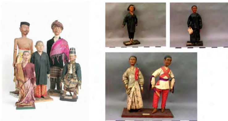
Uit de poppencollectie voor de jonge Koningin Wilhelmina, 1893. Links: pop uit Java, Borneo, Makassar, Atjeh, Minahassa; rechts boven: Molukse kerkgangers, twee Molukkers. Collectie Museum Volkenkunde serie 1108.